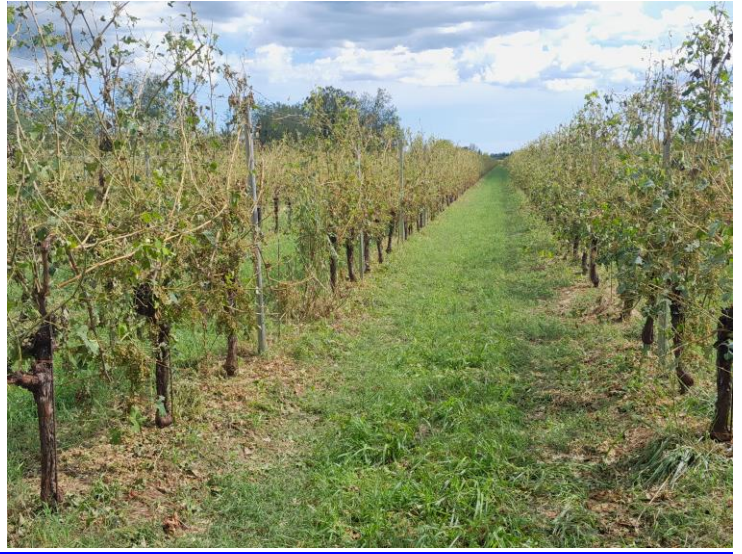
Grandinata del 25 luglio sera a Scomigo di Conegliano