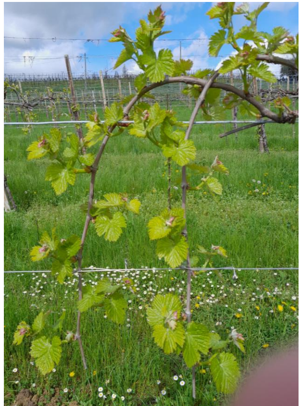
Glera Collalbrigo 2 aprile 2024 (situazione potenzialmente recettiva alla Peronospora)