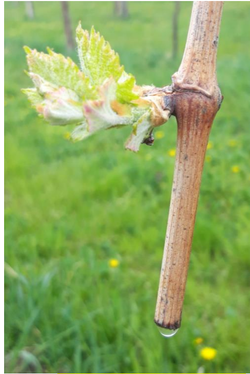
Pianto 29 febbraio - 15 marzo 2024