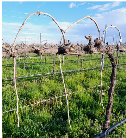
Santa Lucia del Piave 31.03. 2024