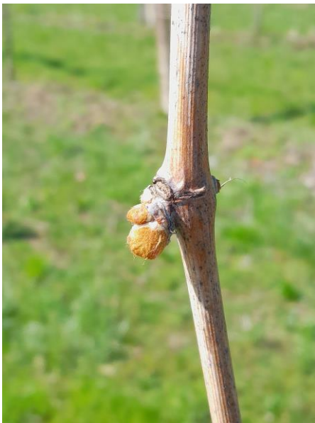
Ingrossamento gemme 12.03.2023 – 5/11 marzo 2024