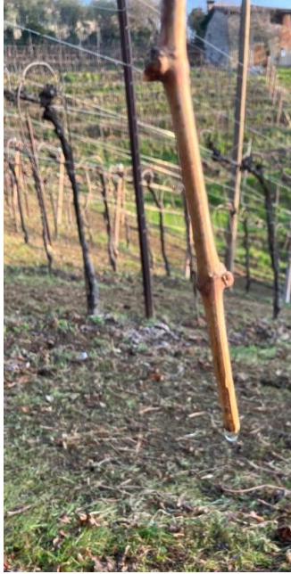
Pianto 5 marzo 2023