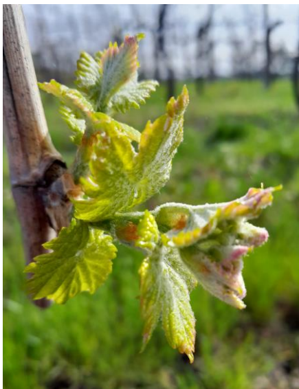
Collalbrigo di Conegliano (27.03.2023 – 22 marzo 2024 )