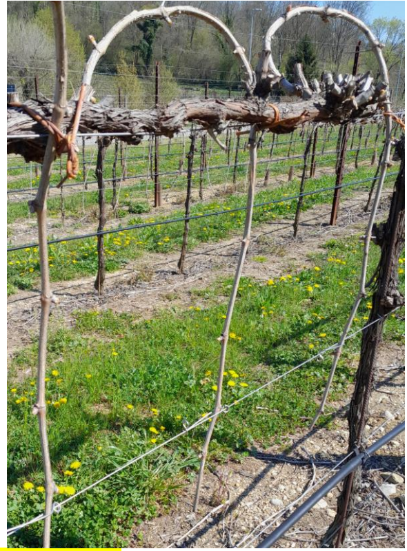
Collina Coneglianese (5 aprile 2023) – 27 marzo 2024 Pianura Coneglianese